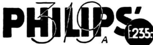
Philips lever boeat segala maksoed Versterker-installaties (perkakas boeat bikin soe-wira terdengar lebih keras) jang tjotjok.

Philips 319 A jang baroe terdasar atas memperbaiki pembikinannya dengan sampurna, pematangan dan schakelng! Beberapa banyak perbaroean dipakakan didalam ini perkakas radio! Penerimaan soe-wira senang dan tetap teresebab netapeningstabilisator! Lampoe 2 kortegolf baroe jang memper-himat pemakaian stroom. Delapan lampoe, pemakaian stroom hanya kira-kira 65 Watt. Schakelcontacten jang diperperak . Penerimaan dan keloearan soe-wira dari kortegolf station jang djajah terdengar baik. Mintalah dipertoendjoekan ini toestel radio jang paling baroe!