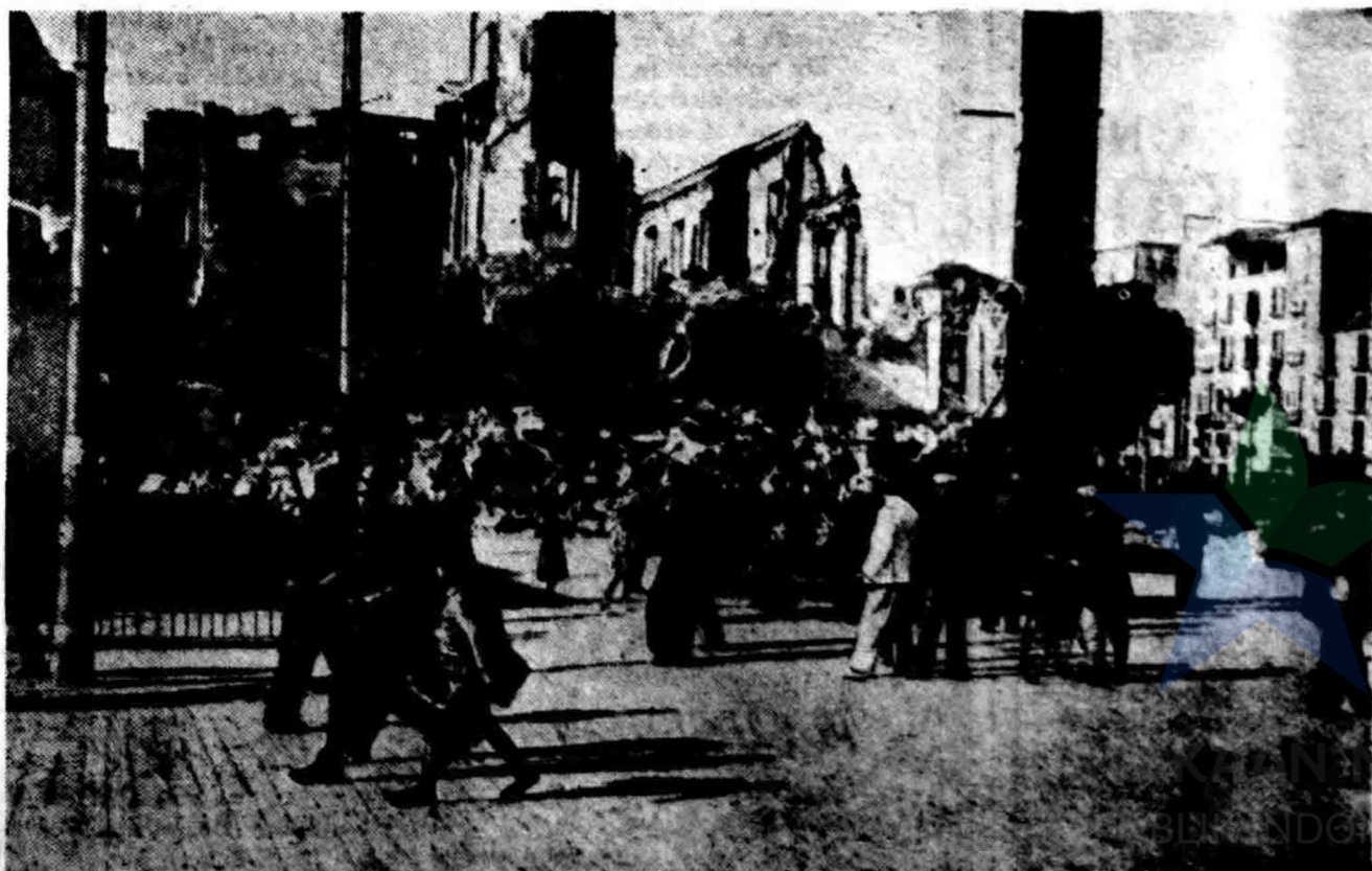
Seoeta penandangan dikota Malaga. Beberapa gedoeng roesak karena bombardement.